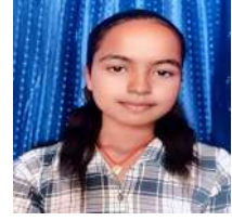
Photo and Signature