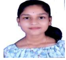
Photo and Signature