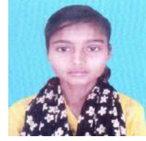
Photo and Signature