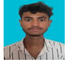
Photo and Signature