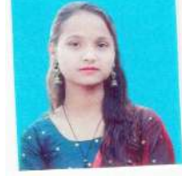
Photo and Signature