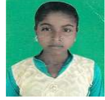
Photo and Signature