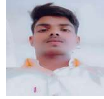
Photo and Signature