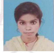
Photo and Signature